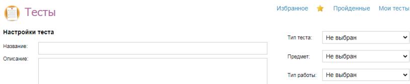
Рис.2. Настройки теста

2. Для создания теста перейдите по ссылке «Добавить тест».